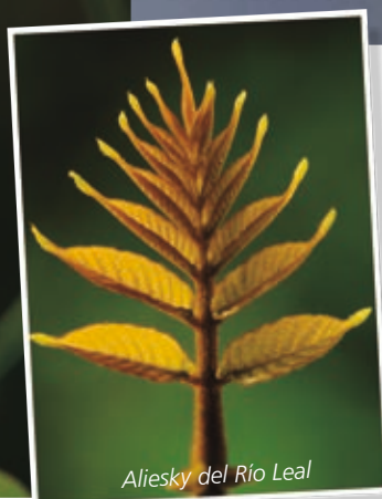
Aliesky del Río Leal