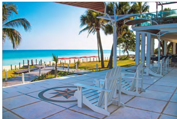
Mystique Casa Perla